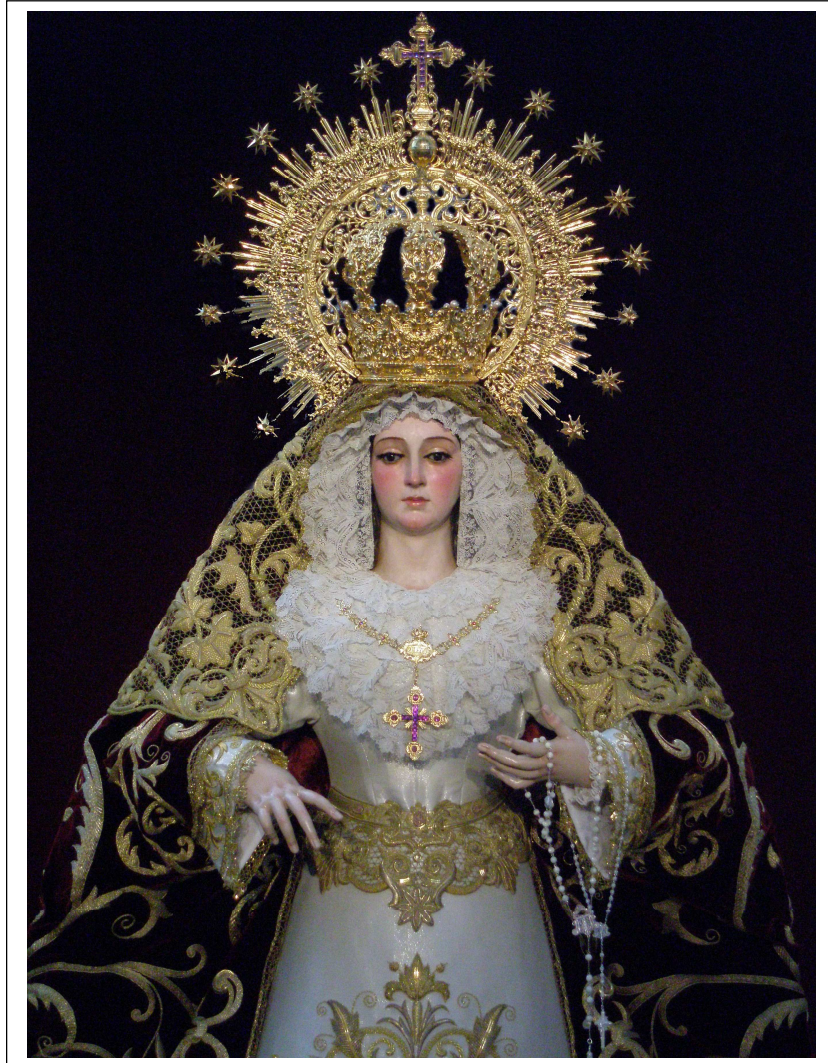
NUESTRA SEÑORA DE LA SOLEDAD CORONADA