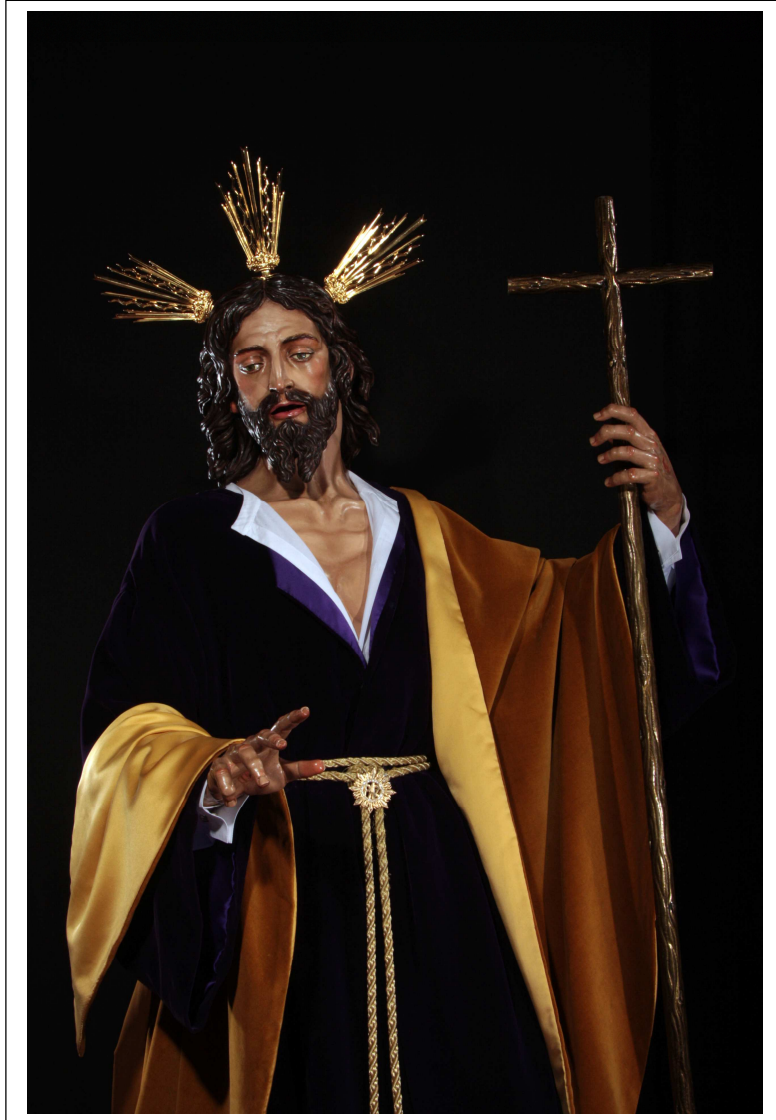
NUESTRO SEÑOR DE LA PAZ