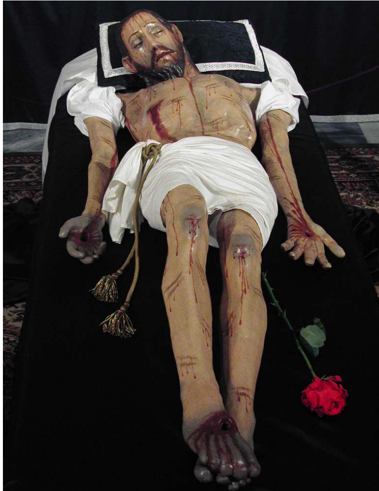
SANTÍSIMO CRISTO YACENTE