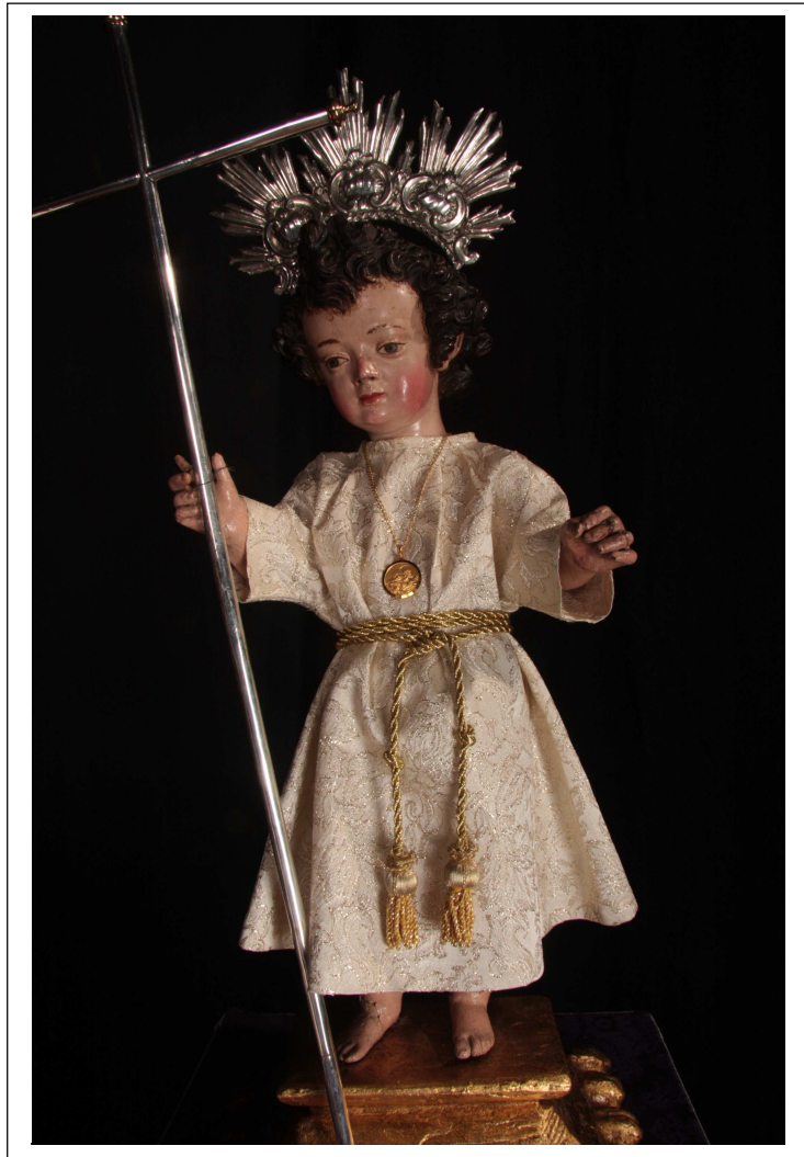
NIÑO JESÚS DE LA SOLEDAD